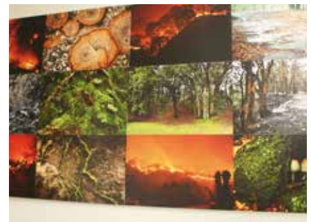
Fotografías presentadas por Selva Negra. En ellas se muestra la vida y la destrucción del bosque.