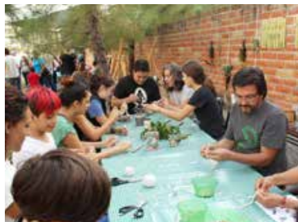
Uno de los talleres para jóvenes y adultos: Flora Nativa