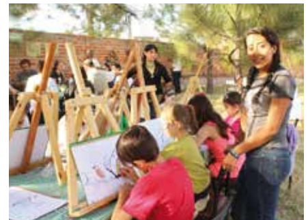
En uno de los talleres para niños, éstos pintaban escenas del bosque.