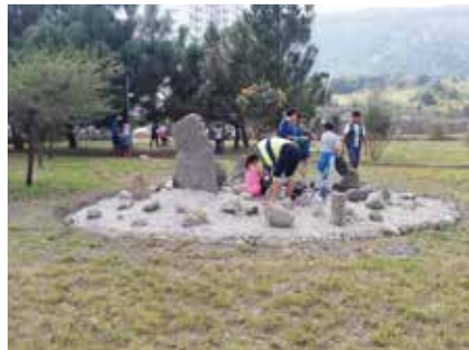
Aquí podemos observar la 'isla de piedras' que es la cuarta estación de este sendero interpretativo; en ella los participantes aprenden acerca de la geología del bosque La Primavera.